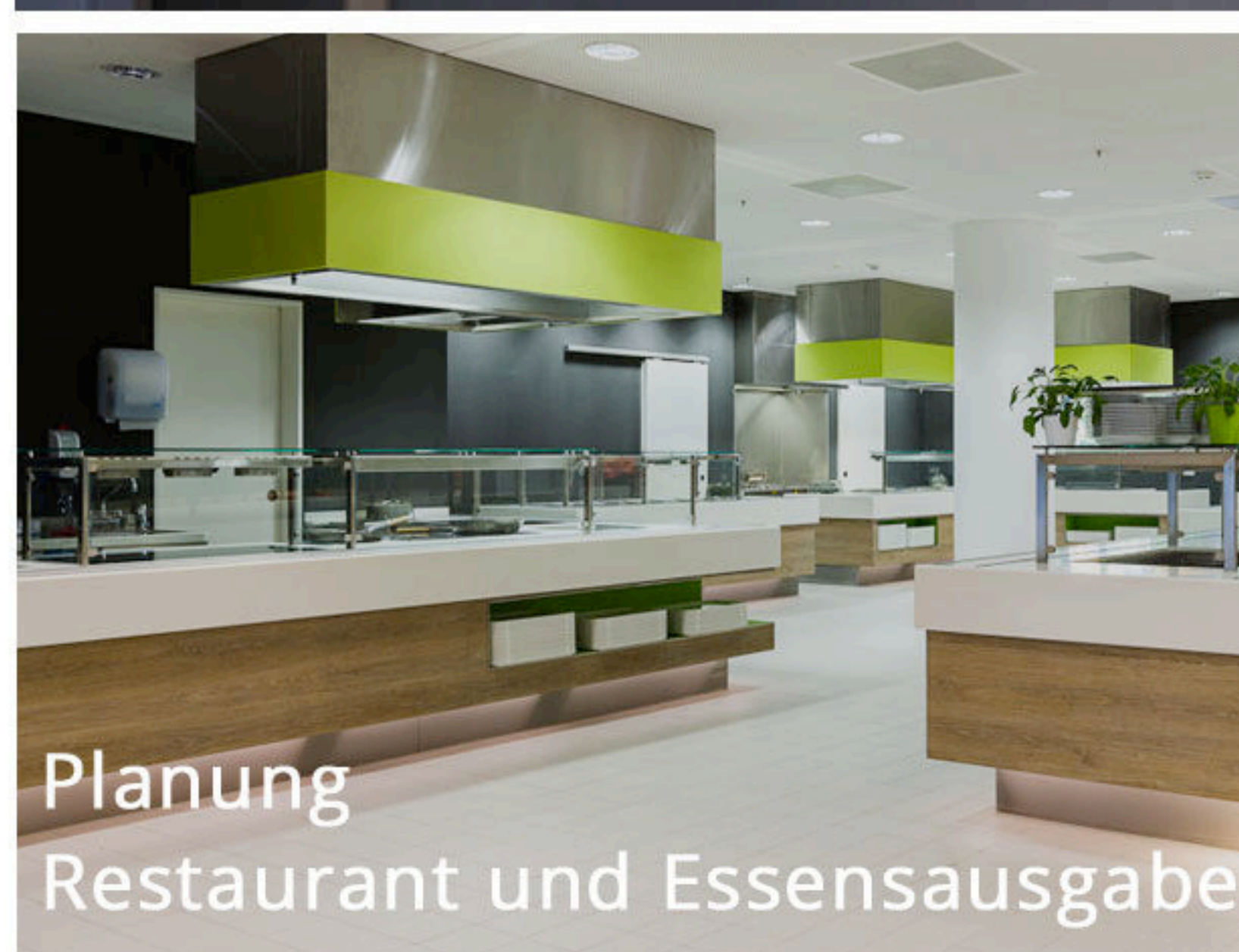
Planung Restaurant und Essensausgabe