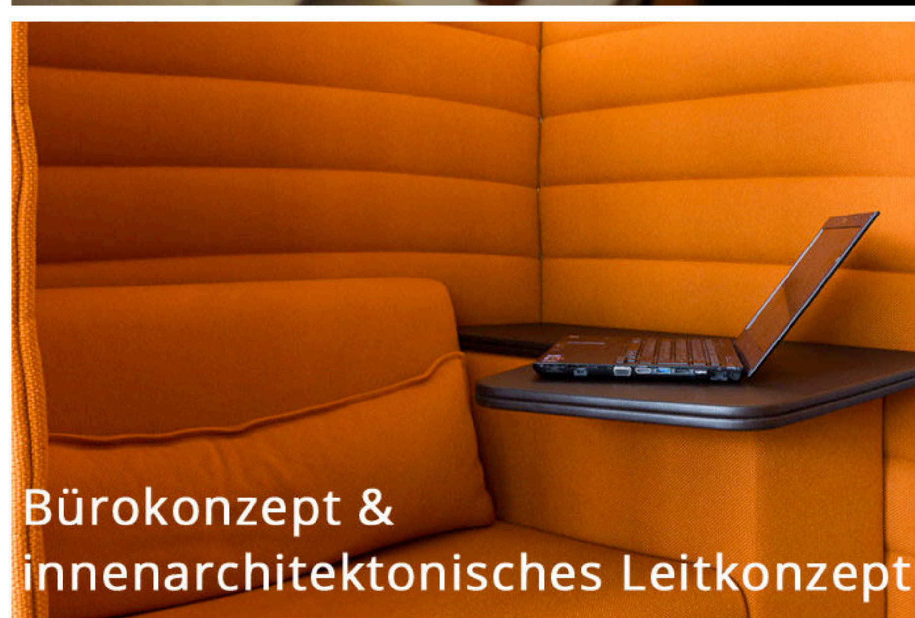
Bürokonzept & innenarchitektonisches Leitkonzept