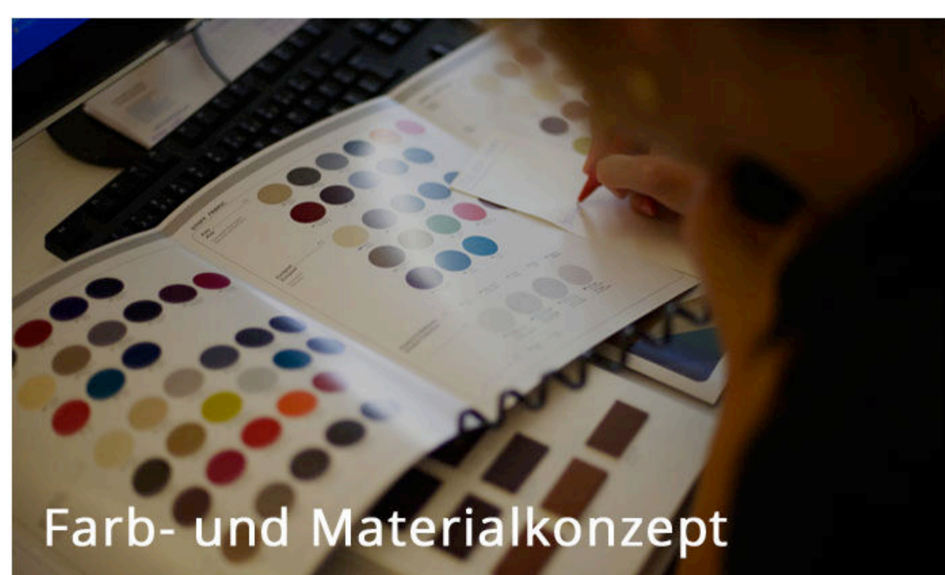
Farb- und Materialkonzept