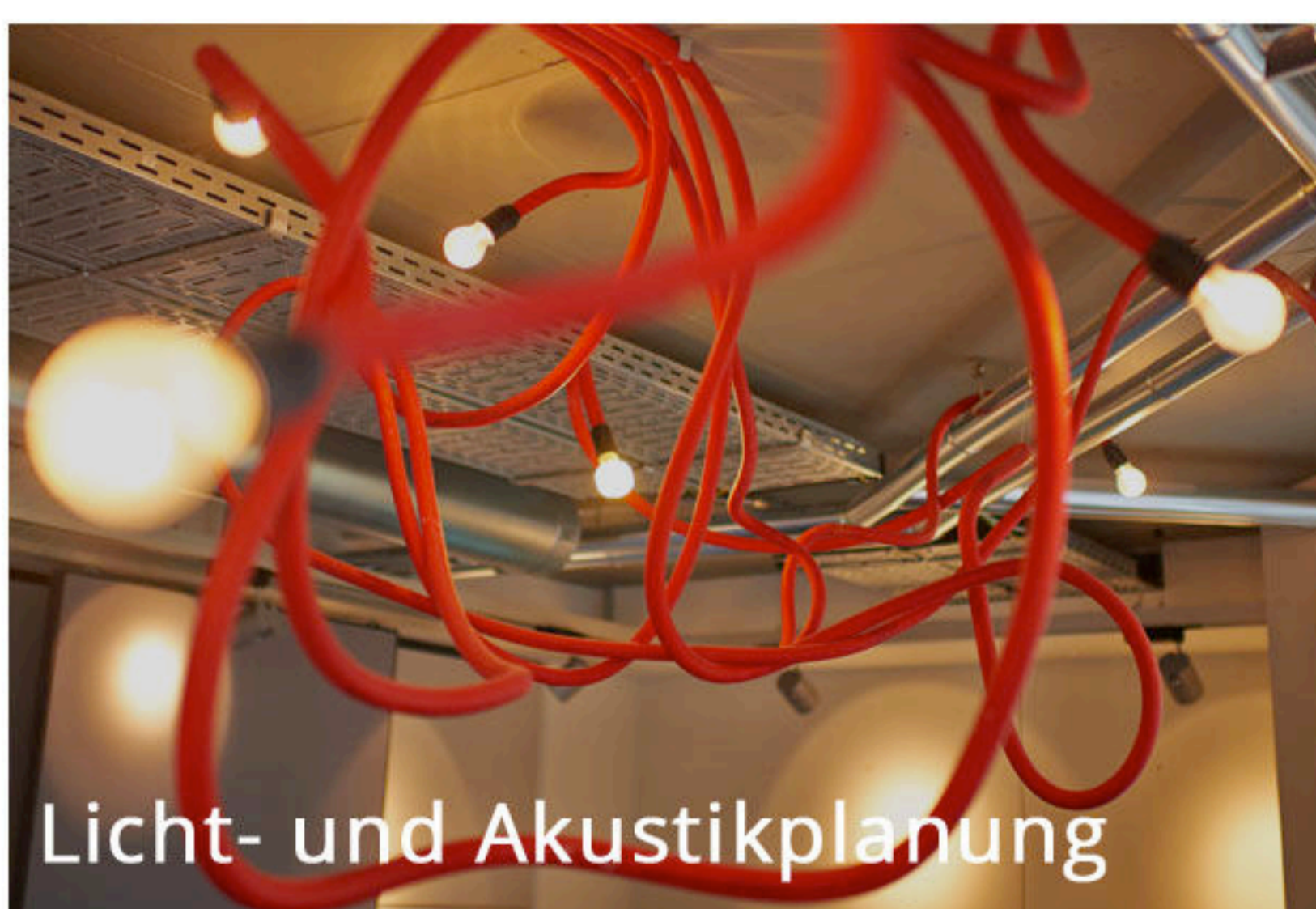
Licht- und Akustikplanung