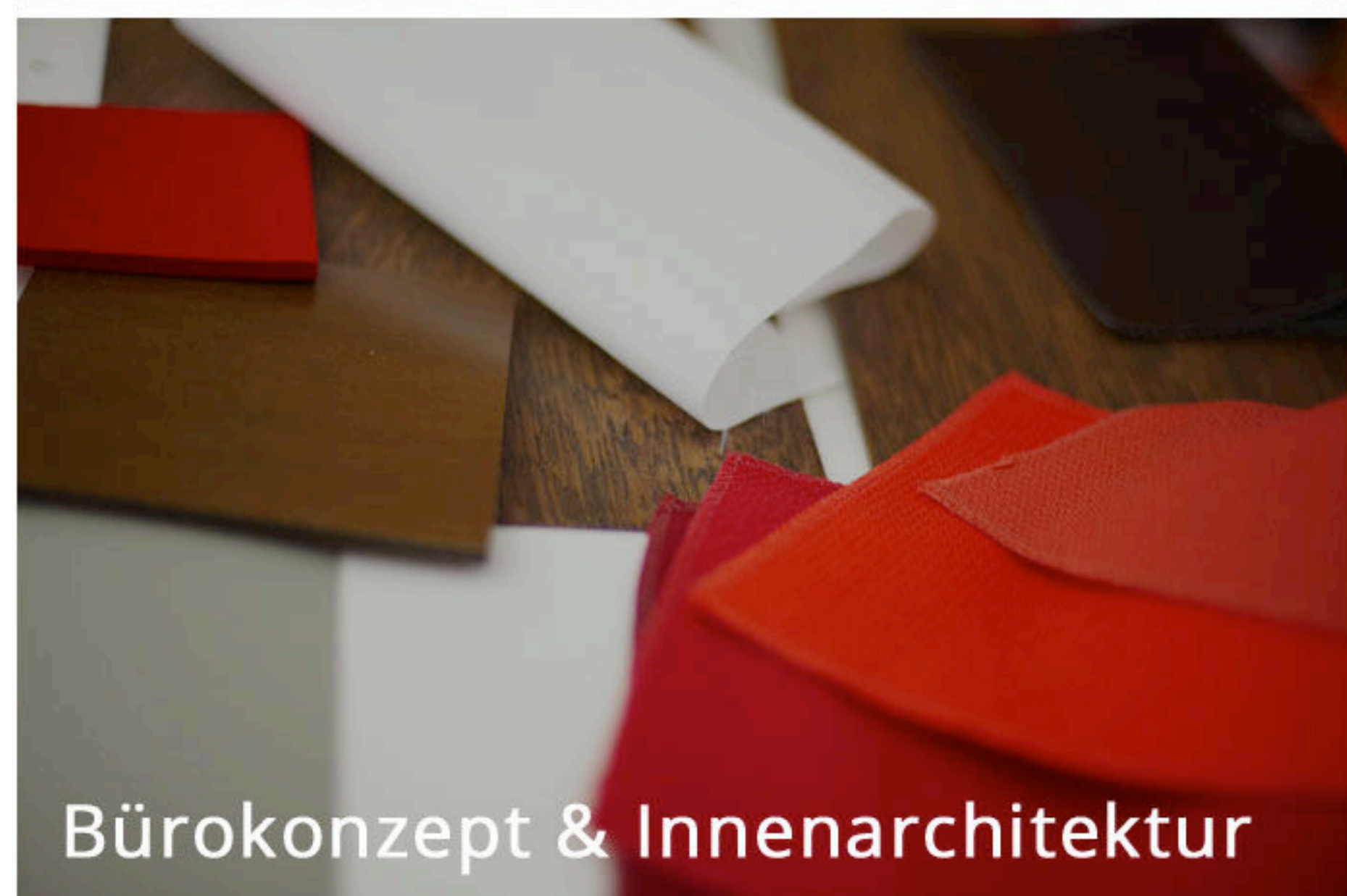
Bürokonzept & Innenarchitektur