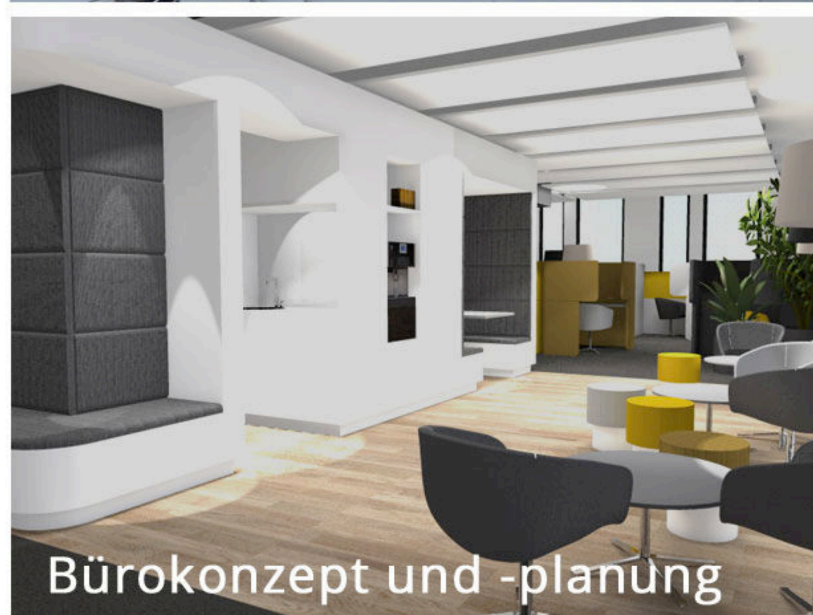
Bürokonzept und -planung